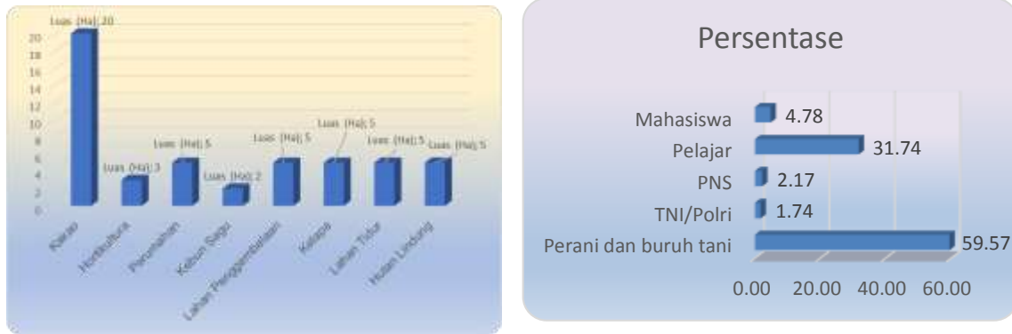
Gambar 2. Luas Lahan (Pemanfaatan) dan Profesi Masyarakat Kampung Imestum dan Nimbokrang